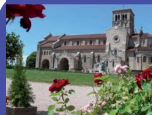
Cluny 2010 en Pays Vichy-Auvergne, communication sur l'identité du Pays, PIBE,....