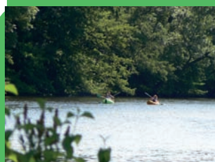
Animation du Contrat territorial du Bassin de Sioule